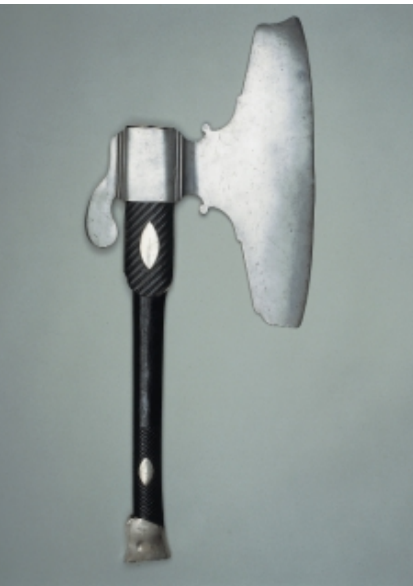
Øksen, der dræbte på Københavns fællede en forårsdag i 1772. Det var sandsynligvis denne økse, som bøddelen brugte, da han henrettede J.F. Struensee.

den dømtes ære, var halshugning. Man kunne blive halshugget med økse eller med sværd. Det var finest at blive halshugget med sværd, selvom det var mere risikabelt og krævede stor dygtighed. Var bøddelen ikke øvet, kunne han have svært ved at ramme rigtigt med det tunge sværd. Så krævede henrettelsen måske flere forsøg.