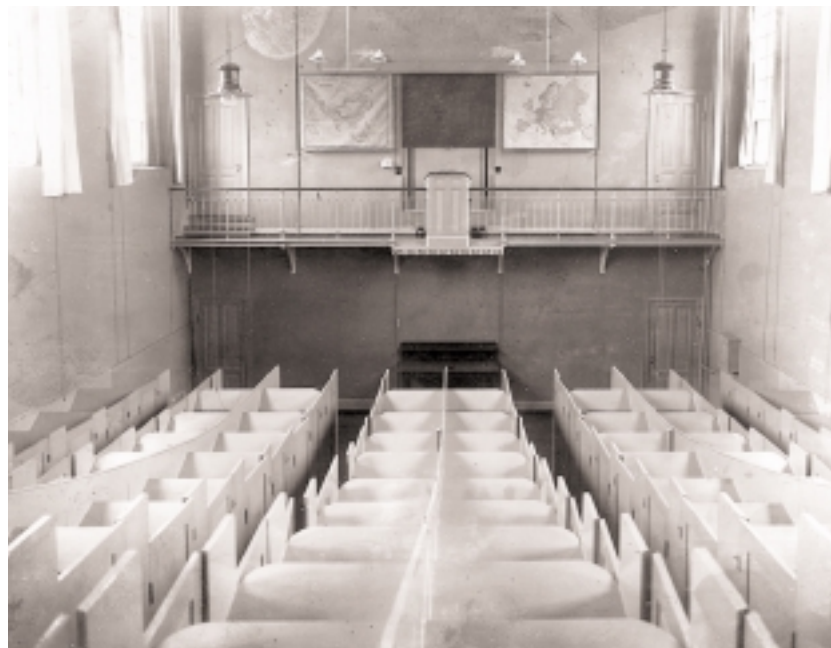
Skolestuen i Vridsløselille Statsfængsel i slutningen af 1800-tallet. Fangerne blev låst inde i hver deres bås, når de skulle undervises.

De nye fængsler var indrettet til at holde fangerne adskilt og overvåget døgnet rundt. I kirken kunne den indsatte ikke se andre end præsten, der til gengæld holdt øje med alle fangerne på en gang.