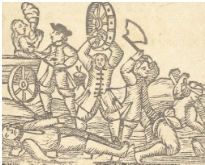
De tre rovmordere fra Frederiksberg fik i 1773 en skærpet dødsstraf. De blev pint og plaget inden deres henrettelse.

Dagen begyndte med, at røverne blev ført fra det sted, hvor de havde begået forbrydelsen, til der, hvor de skulle henrettes. Undervejs blev de knebet i overarmene med rødglødende tænger. Folk kom løbende for at se på. Ved rejsens slutning blev de halshugget, men inden selve henrettelsen blev de tre røvere pint på det groveste. Den ene fik knust alle knogler i kroppen. Han blev derefter lagt til at dø på et hjul, der blev sat på en oprejst pæl. De andre to fik først afhugget hver en hånd, der blev sømmet fast på hver