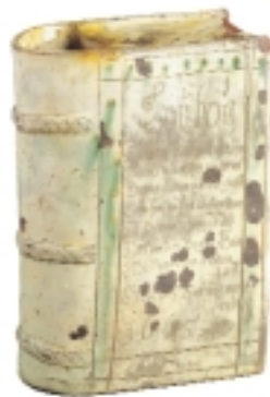
Tyvekrus eller fikserkrus fra 1665 udformet som en lovbog.

De personer, som ikke overholdt samfundets regler, kunne straffes på mange måder. Havde en bonde stjålet, kunne han blive tvunget til at holde en fest for alle i landsbyen. Andre steder skulle den skyldige som straf drikke af tyvekruset. Tyvekruset var et krus, der ikke kunne komme noget ud af. Når landsbyens mænd så mødtes for at drikke, blev tyven ydmyget ved gang på gang at løfte bægeret til munden uden at få den mindste smule øl ud af det. Det var nok ikke kun den tørre hals, der sved!