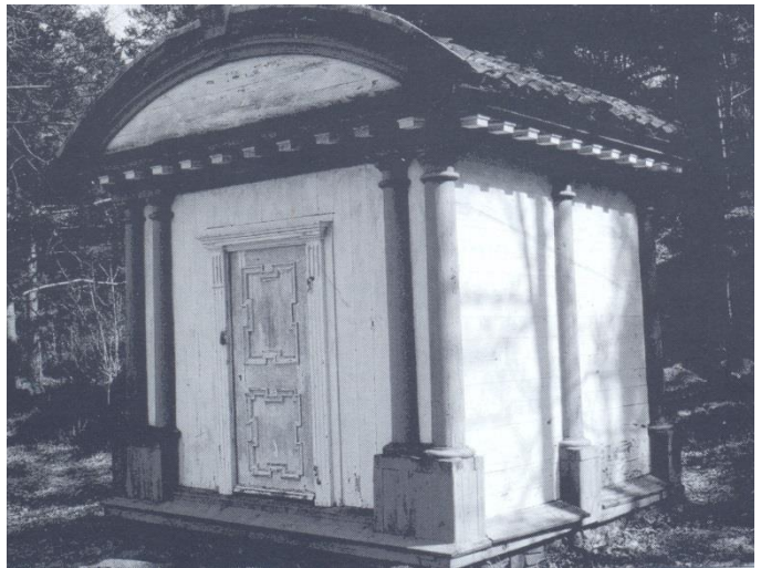
Stiftamtmandens paviljong (fra hus til hus – Vest Agder Fylkesmuseum)

❖ NNU Rapport nr. 33 - 2013 Af Charlotte Kure Brandstrup