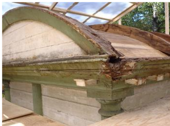
Restaurering af ”Stiftamtmandenes paviljong”

Tre prøver fra ”vindskeder” over indgangen (N2491049, N2491059, N2491069). Heraf stammer N2491059 og N2491069 fra samme træ. De to årringskurver er regnet sammen til trækurven N249t002 der omfatter 82 årringe.