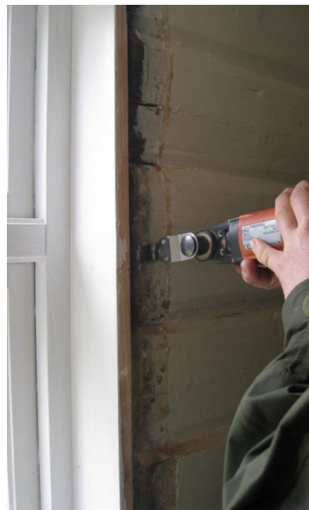
Figur 1: Delskiver udtages fra den gamle tømmerkerne fra vindueskarmen.

Prøverne omfatter imellem 41 og 71 årringe. Derudover er der synligt splintved på prøve nr. fem. Det er ikke muligt at bestemme splintved på de resterende prøver.