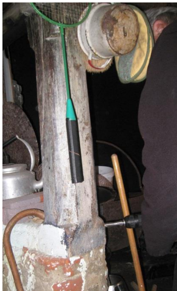
Figur 3: Boreprøve udtages af egestolpe i bryggerhus.