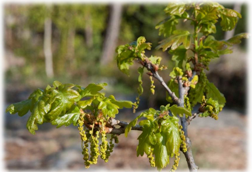
Quercus petraea (vintereg)

Nationalmuseet Forskning og Formidling Danmarks Oldtid - Naturvidenskab Dendrokronologi