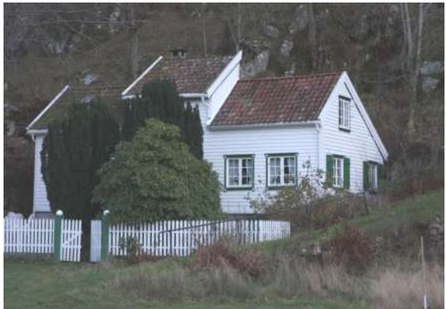
Våningshus Dalheim (Hidra 10)