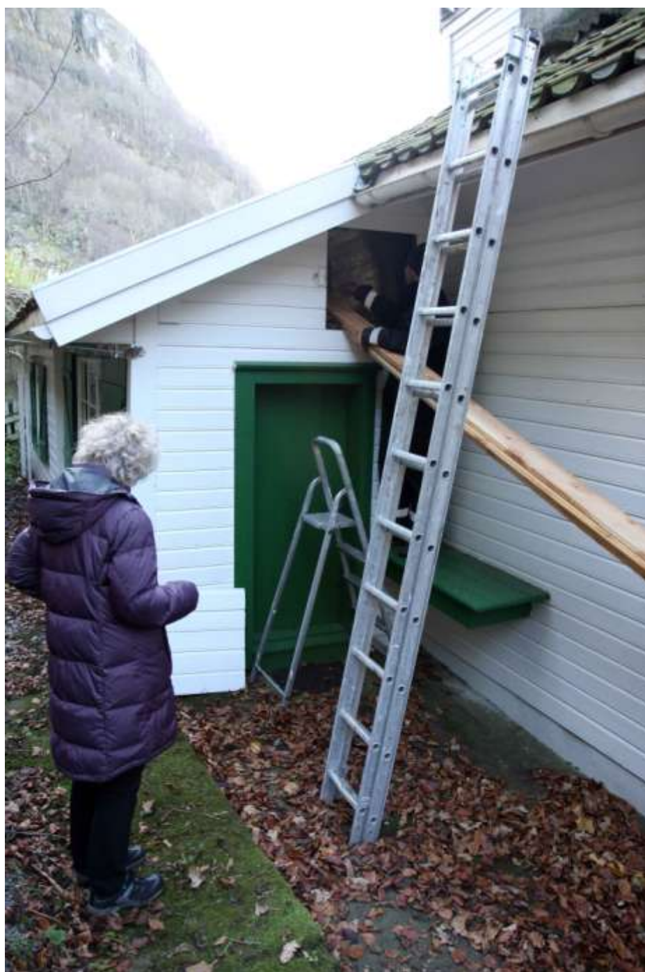
Prøveudtagningen fra krybeloft over hovedhusets tilbygning.