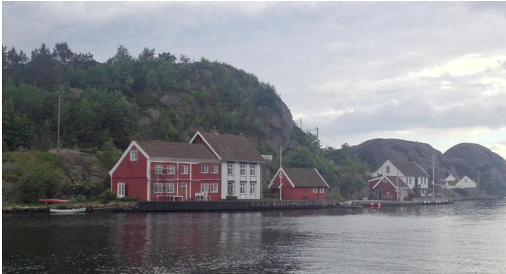
Figur 2: Det gamle Gjestgiveri set fra havet.