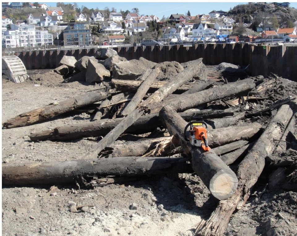
Figur 1. Prøver udsaves af hele stammestykker fra bolværket.

Under et anlægsarbejde blev der fundet et bolværk, som er ønsket dateret. Ligeledes kan materialet anvendes til grundkurveopbygning.