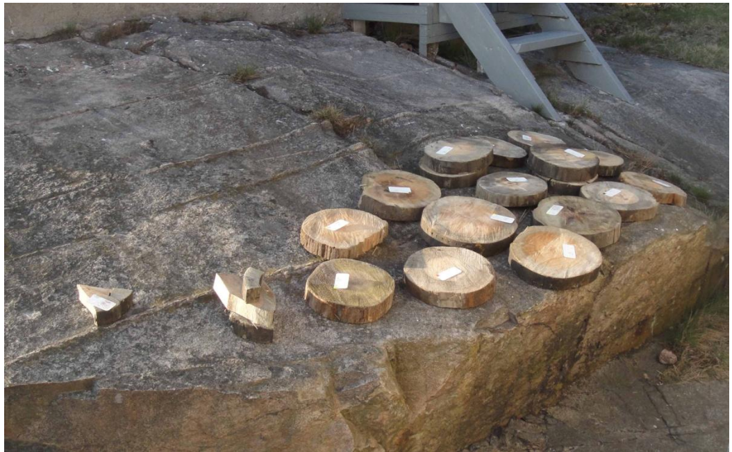
Figur 2. Skiver udtaget i tværsnittet af hele stammestykker.

Prøverne er udtaget som skiver/tværsnit (Figur 2). 3 skiver er fortsat komplette, mens der er udkløvet to kiler af de resterende 15 skiver, som hver udgør en prøve a og b (se katalog).