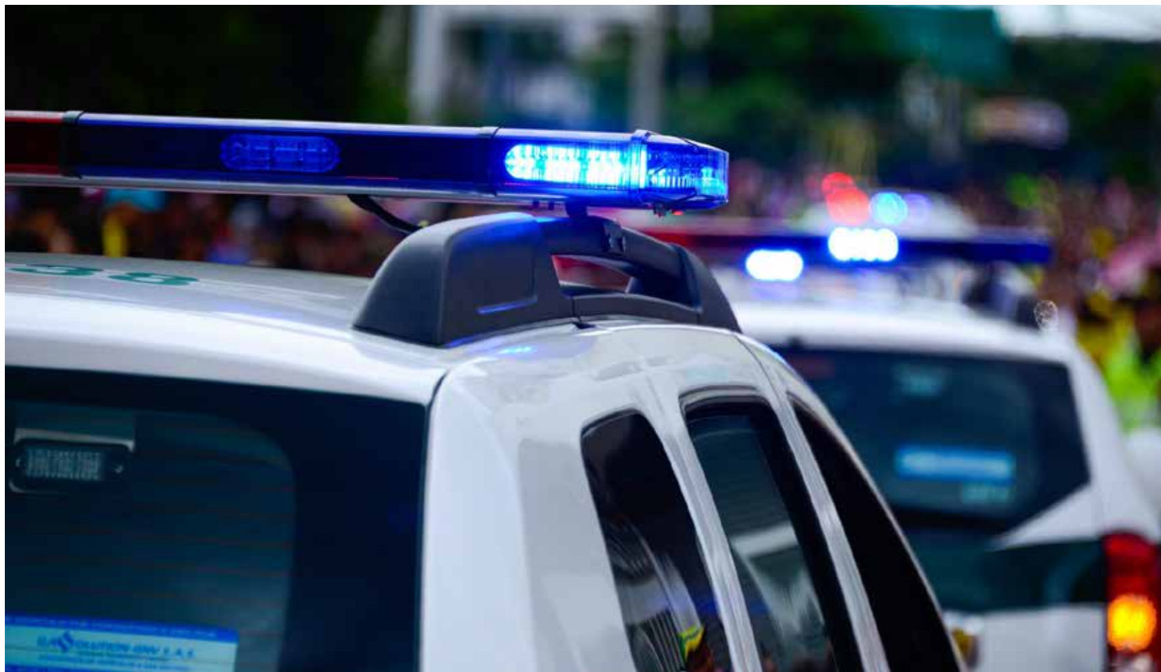
Billede: Politibiler.

Ambulancer og politibiler har forskellig udryknings-signaler. De fortæller, at man nu skal flytte sig, så de kan komme hurtigt forbi for at redde liv eller for at fange en tyv.