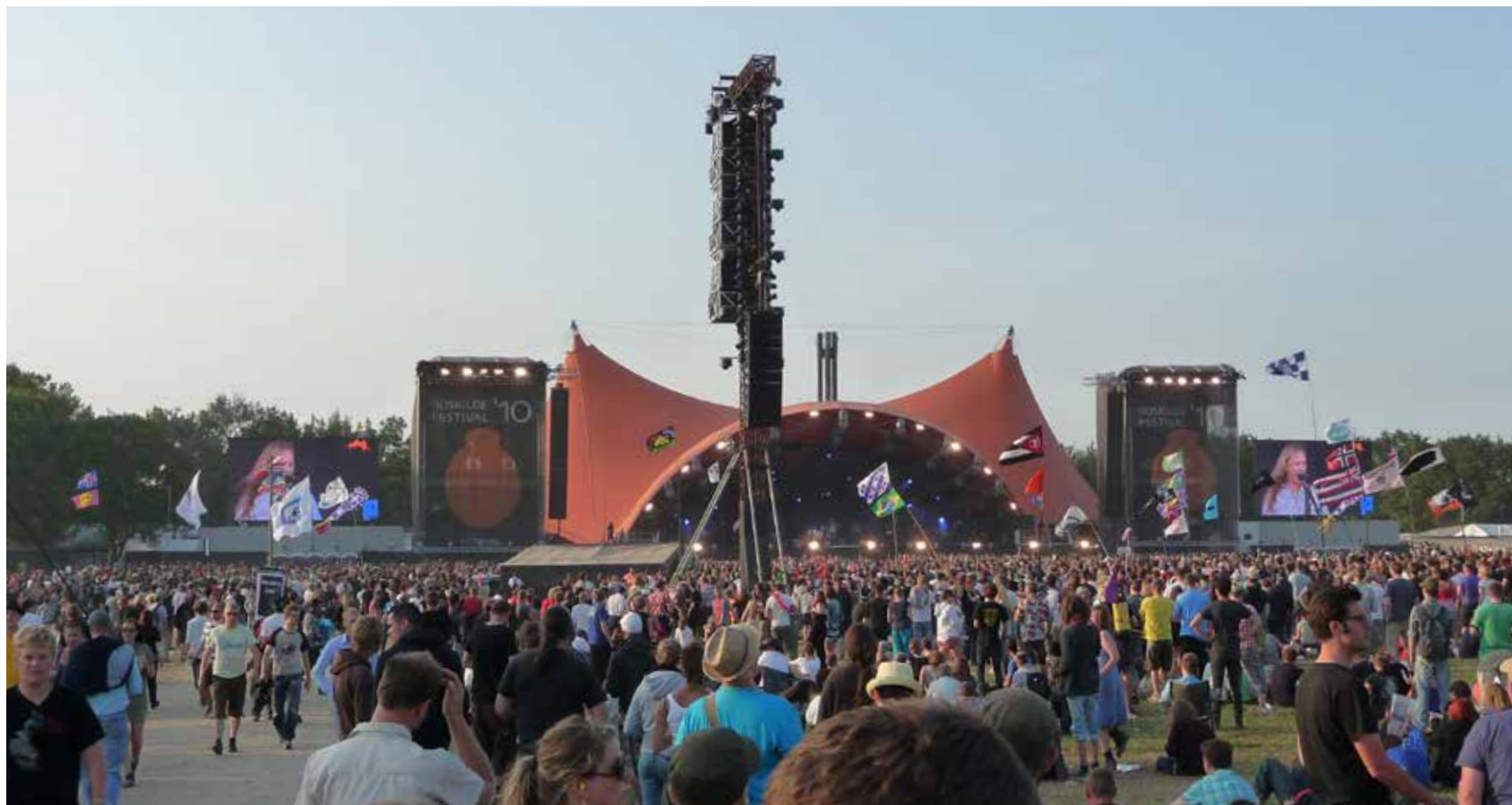
Billede: Roskilde festival 2010. Vi lytter til musik i fælles- skab.

Alle eksemplerne har et element af gentagelse og enkelthed, som gør, at mange kan være med.