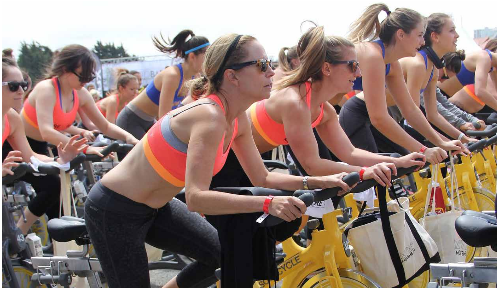
Billede: Spinning med højt tempo.

Vi kan også bruge musik til at holde et arbejds-tempo. I nogle fiskersamfund kan fællessang eller en trommerytme hjælpe til at få alle til at trække i takt, når båden skal trækkes på land.