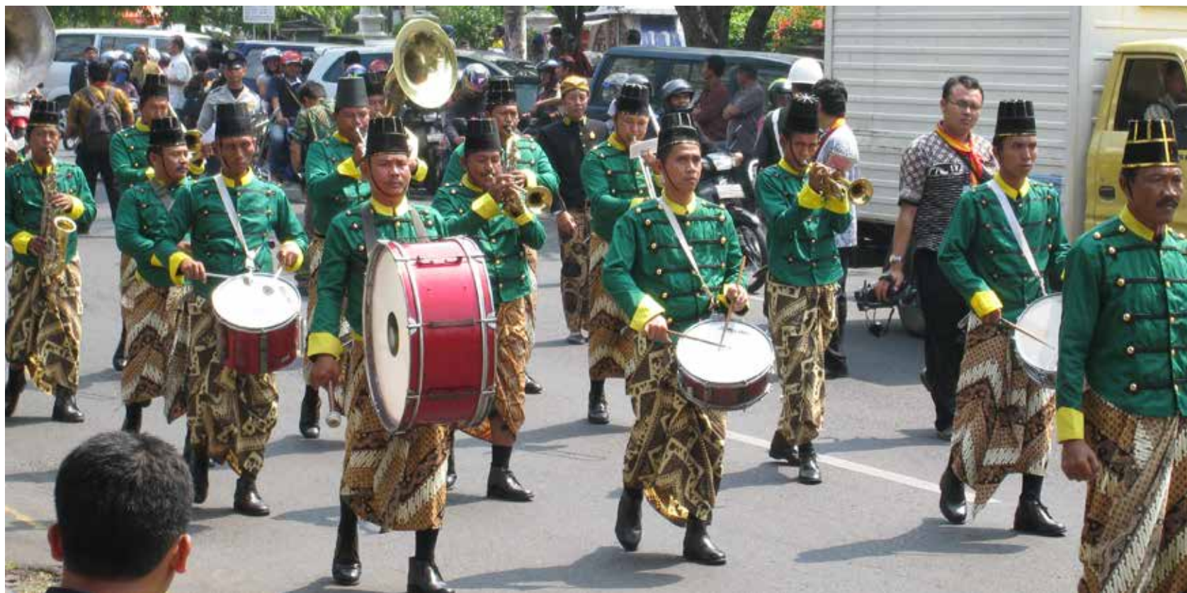
Billede: Bryllupsoptog fra Surakarta, Indo- nesien. Musikerne annoncerer bru- dens ankomst.

Ved begravelser hjælper musik os med at vise de svære følelser. Den skaber en ramme, som vi kan holde os til, når det er aller sværest. Den indleder, afslutter og bringer os videre.