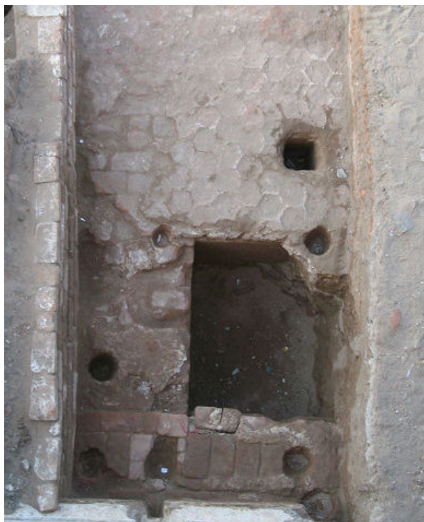
Den inderste del af broen over voldgraven med spor af bikubeformet brolægning og stensat nedgravning til vindebroens kontravægt.

bevaret adskillige tegninger af broer, men de fleste må have været forslag, som aldrig er blevet realiseret. En enkelt passer dog nogenlunde med de bygningsarkæologiske iagttagelser, og kan have været tegningen til den bro, som blev realiseret.