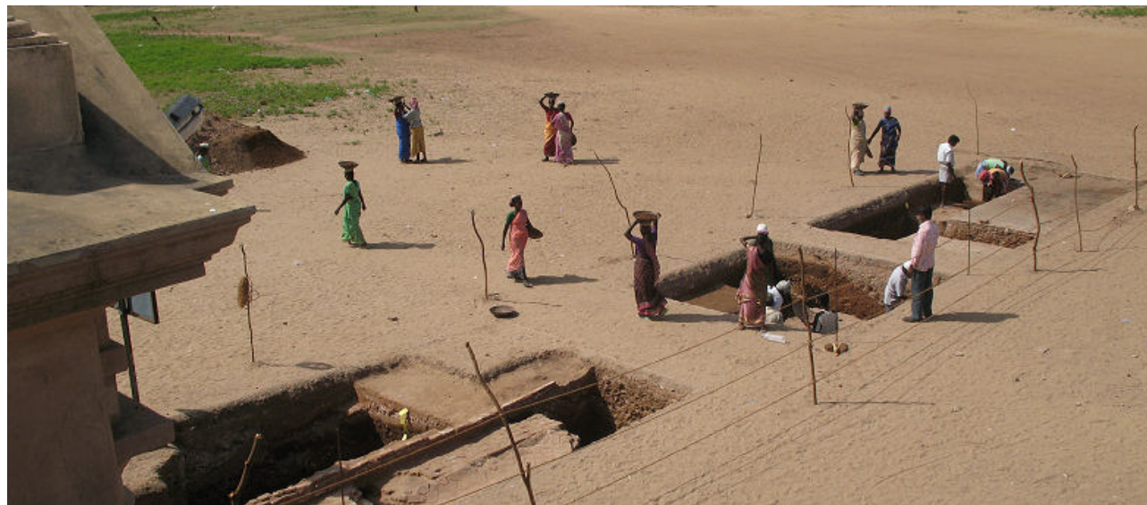
Alt arbejde i forbindelse med udgravningen foregik med håndkraft. I Tranquebar er det kvindearbejde at fjerne jorden.