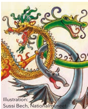
Illustration: Sussi Bech, Nationalmuseet.