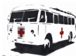
Illustration: Betina Miemietz, Nationalmuseet.