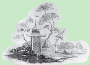
Motiver fra vægge i Norske Hus

Tanken om at skulle bo blandt grantræer, øverst på "fjeldet" og i en hytte, ville give de fleste 1700-tals mennesker hjertebanken af spænding. Det var meget eksotisk.