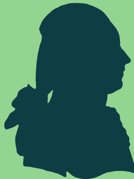
Antoine de la Calmette