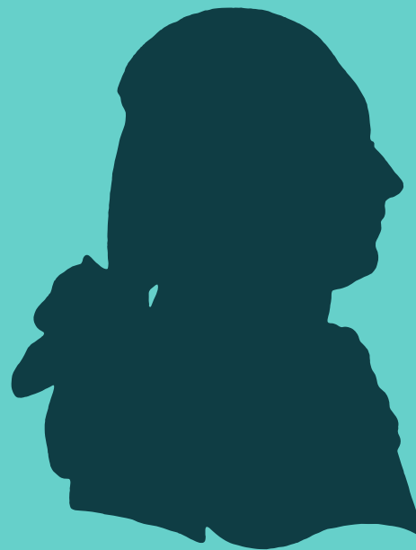
Antoine de la Calmette