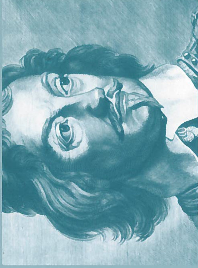
Generalguvernør Johan Maurits af Nassau-Siegen.

Eckhouts billeder er blandt de første fra Brasilien, og de tillægges stor naturhistorisk og etnografisk værdi på grund af deres afbildninger af Brasiliens natur, planter, dyr og befolkningsgrupper. Men malerierne rum-