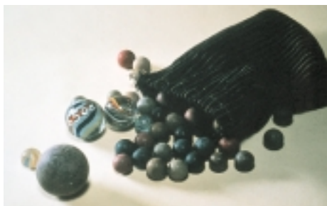
Man havde sine ler- eller marmorkugler i en stofpose.