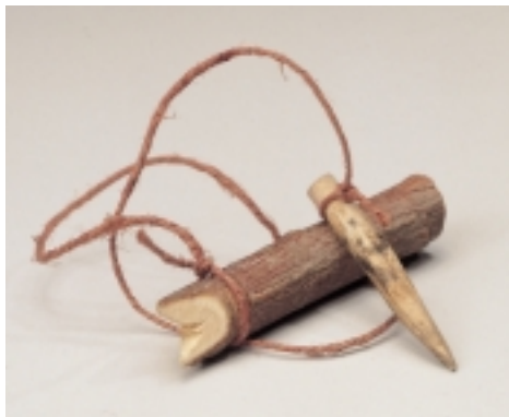
Træpinden forestiller en ko med en tøjrepæl.