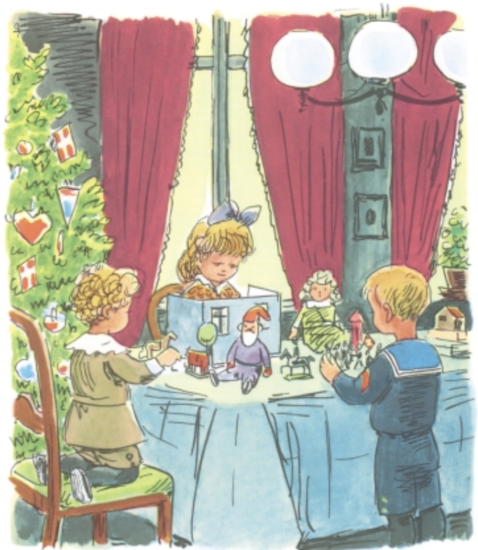
Peters Jul: Peter, Knud og Hanne leger med det legetøj, de har fået til jul.