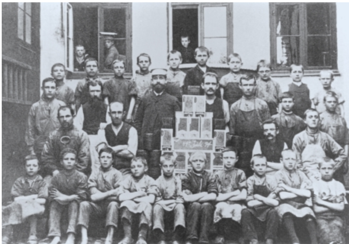
Børn der arbejdede på Holbæk Cigar- og Tobaksfabrik. Tæl, hvor mange børn der er!