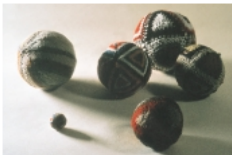
Børn lavede selv bolde af håret fra får eller køer. Bagefter syede man fine mønstre af farvet garn udenpå.