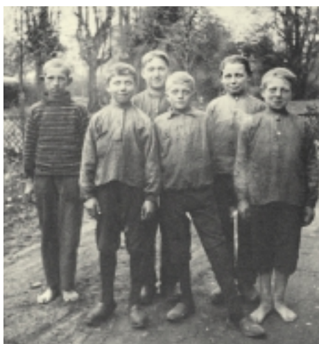
Arbejdsdrenge fra klædefabrikken Brede.

Om søndagen og i de få fritimer legede børnene. Legekammerater var der som regel nok af. Men indendørs var der sjældent plads til leg. Så brugte man gaden eller baggården. Man legede skjul, gemmelege og tagfat. Pigerne sjippede, hinkede, spillede bold og legede sanglege. Drengene legede med top, spillede med knapper eller kugler og løb med trillebånd. Dyrt legetøj og cykler var der ingen arbejderbørn, der havde.