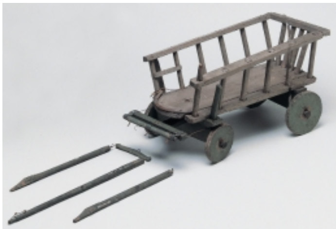
En høstvogn i legetøjsstørrelse.

Det var ikke let for den lille dreng at forlade sit hjem, kun fem år gammel. Men han kom til at bo hos sin onkel og tante, som behandlede ham godt. Han lærte også at læse og skrive og behøvede ikke at skifte plads.