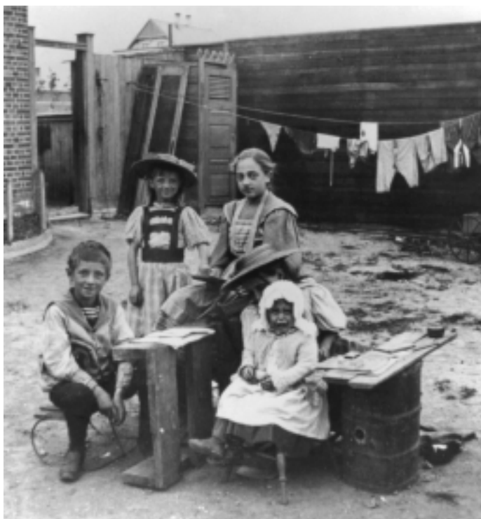
Børnene leger skole i gården. I hjørnet bag børnene kan man se dasset.

Ligesom på landet gik børns arbejde ud over skolegangen. Nogle steder gik børnene i skole den halve dag og arbejdede resten af dagen. Andre steder arbejdede de en dag og gik i skole den næste. Nogle børn var så trætte, at de faldt i søvn i timen. De blev som regel vækket med et rap over fingrene. Nogle lærere havde dog ondt af børnene og lod dem sove videre. Men i 1873 begrænsede en lov børnearbejdet. Kun børn over 10 år