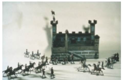
Drenge legede med soldater lavet af tin.