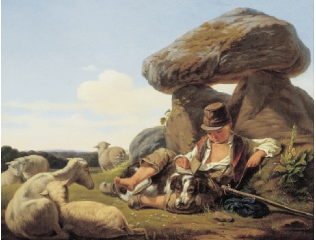
Maleri af en vogterdreng fra omkring 1840. Sammenlign med billedet af vogterdrengen på side 6.