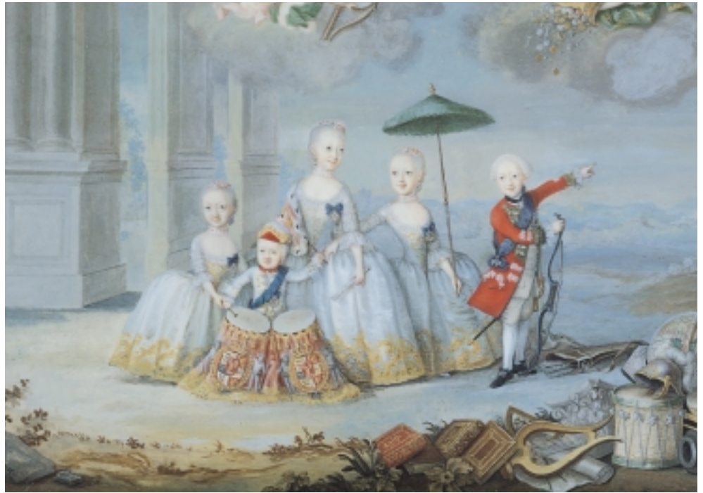
Frederik den 5.s børn. 1756. De er fint klædt på, og håret er sat op.