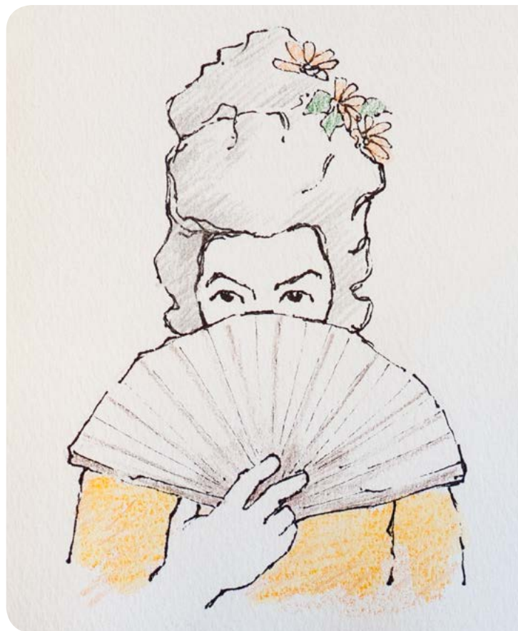
Betyder: Følg mig.