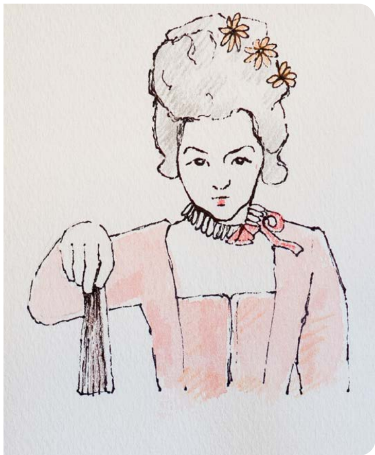
Betyder: Jeg hader dig.