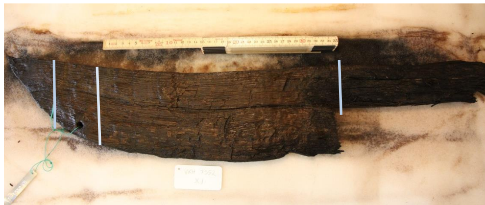
Figur 1: Prøve fra smededammen, Jelling VKH 7352 - X1. Tre radier målt, vist ved lyseblå linier.

En prøve modtaget af egetræ ( Quercus sp.). Prøven kan ikke dateres. Prøven består af 46 årringe. Der er ikke bevaret noget bark eller splintved på prøven.