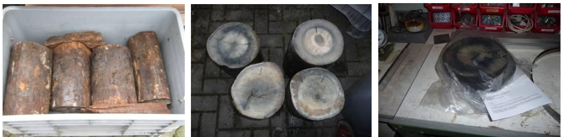
Fig. 1-3. Fundamentspæle fra Rotterdam

Den sidste prøve (Z0160049) af fyrretræ dækker over 93 år. Prøven kan ikke dateres.