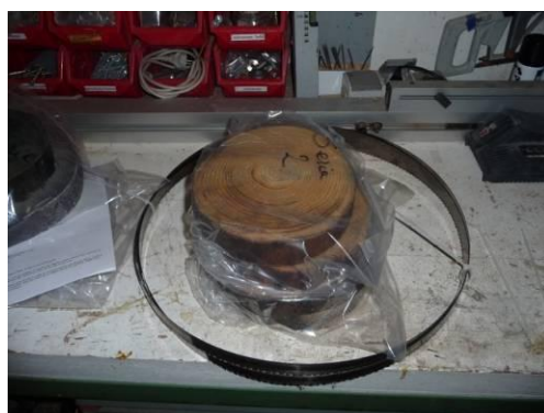
Fig. 6-9. Prøver fra fundament fra Kampen.