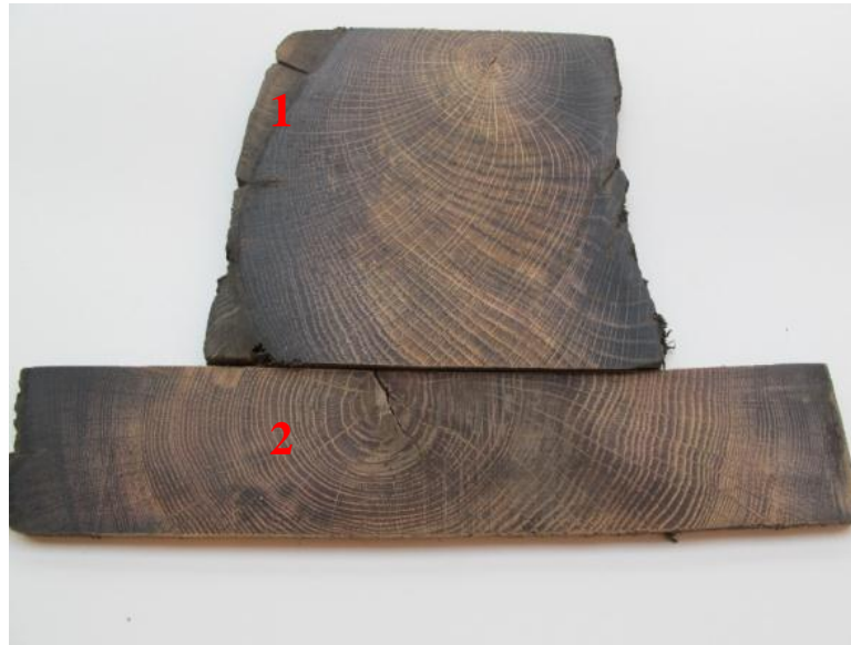
Fig. 4. Prøver af eg fra fundament fra Kampen

Prøverne stammer fra et fundament i Kampen. Fundamentet er fundet under kirketårnet til kirken Onze Lieve Vrouwekerk / Buitenkerk . Fundamentet menes at være etableret omkring 1453, men ifølge historiske dokumenter, er kirken bygget i 1335 og udbygget i 1369.