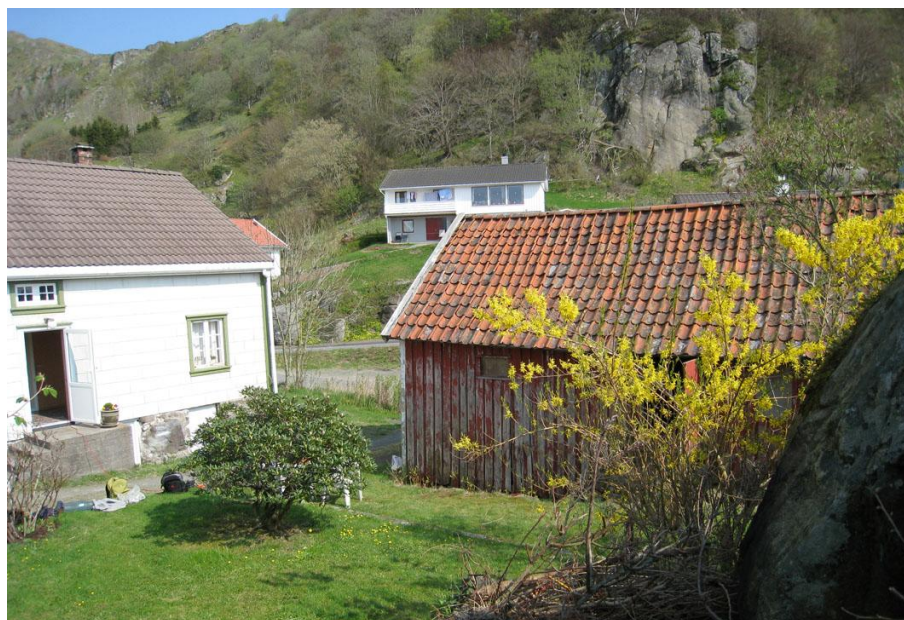
Våningshus og låve(Hidra 6)