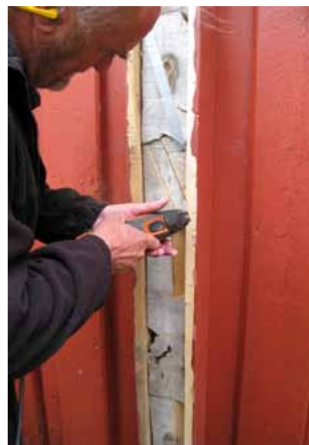
Figur 1. Prøverne udtages fra vægstokke i form af kile.

Den yngste konstaterede årring er dannet i år 1795 (prøve N2410039). En tolkning af dateringsdiagrammet (Figur 2) viser, at træerne, som prøverne stammer fra, sandsynligvis er fældet mere eller mindre samtidig – inden for få år efter 1795 e.kr. Dette er formentlig også tidspunktet for opførelsen af bygningen. Antagelig ikke meget senere, idet vi går ud fra, at tømmeret, som traditionen bød sig, blev anvendt med det samme.