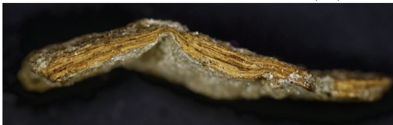
Billede af radialsnit med aftryk efter mønt.

Ud over det sad der et meget lille stykke trækul på. Dårlig bevaringstilstand, smuldrer, ikke nærmere bestemt.