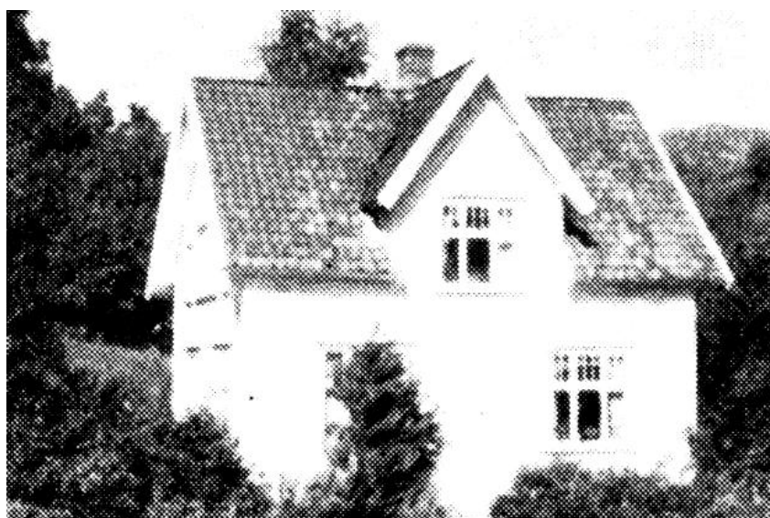
Våningshus (Hidra 12)