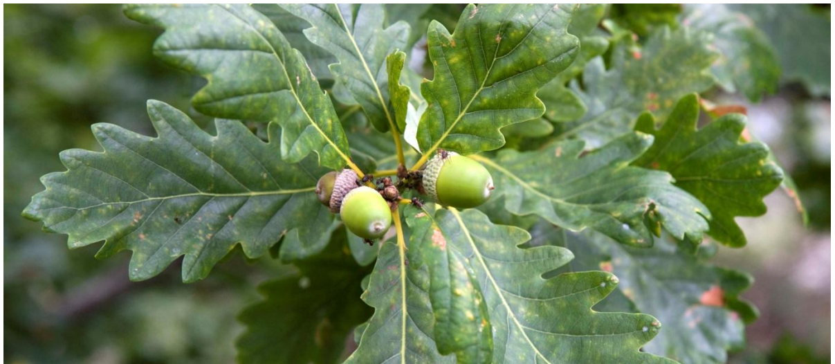
Quercus petraea (vintereg)

Nationalmuseet Forskning og Formidling Danmarks Oldtid - Naturvidenskab Dendrokronologi