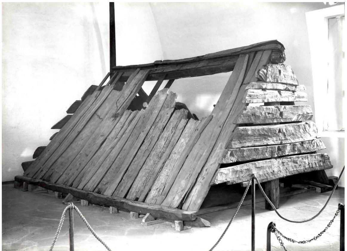
Gravkammeret fra Oseberghøjen, opstillet i Vikingeskibsmuseet på Bygdø i Oslo. Foto: L. Smestad, 1934.