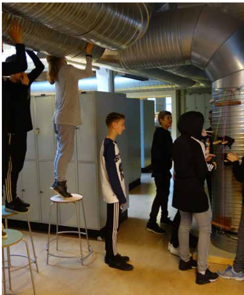
Billede Publikum skulle på denne lydvandring bl.a. lægge ørerne til ventilationsrø- rene.