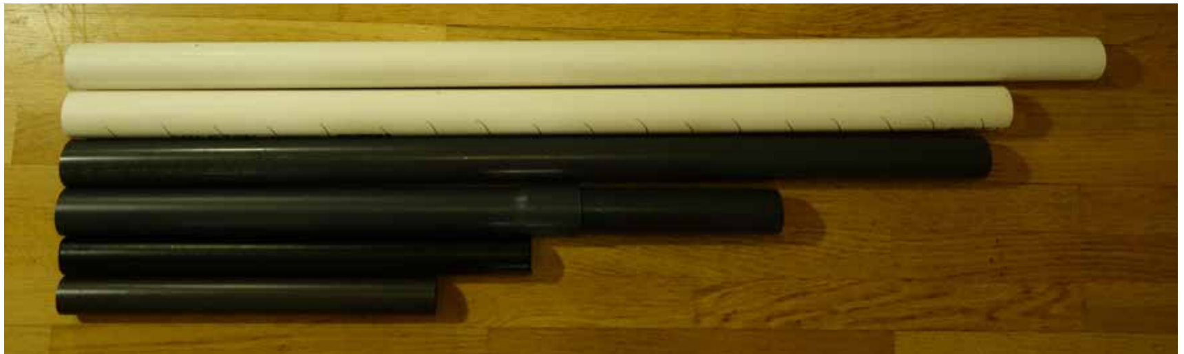
Billede: Plastik rør.

Tonen bliver dybere, jo længere røret eller strengen bliver. Men det gælder altså kun, hvis tykkelsen/vægten/spændingen er det samme. Derfor er det relativt.