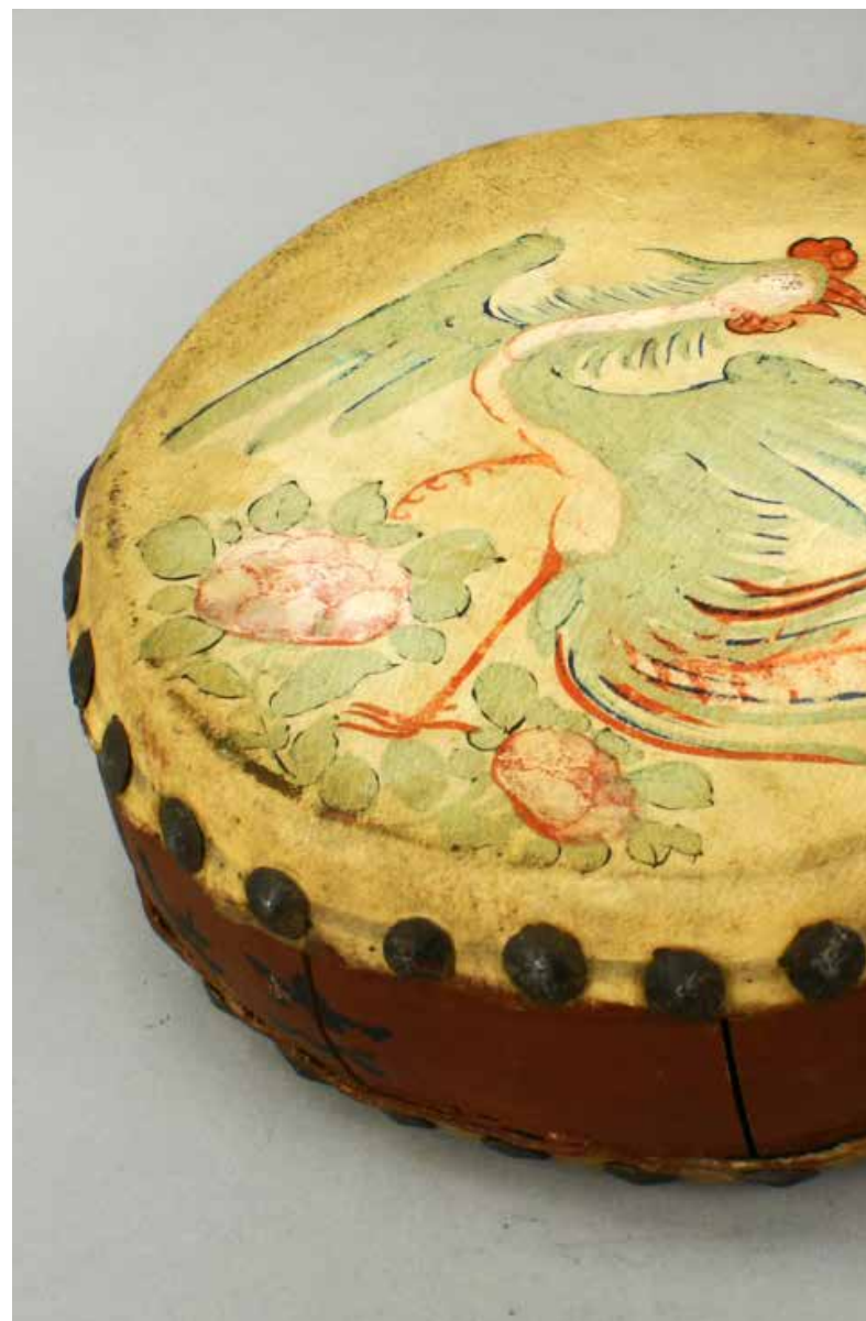
Billede: Tao-ku tromme fra Musikmuseets samling.