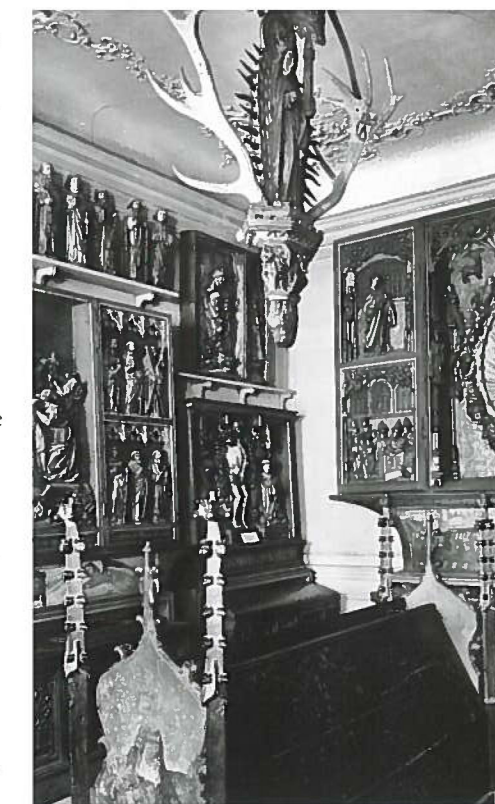
Et af udstillingsrummene i Prinsens Palæ i 1901. Rokokorummet er fyldt med gotisk kirkeinventar.

På sin hundredårsdag stod Nationalmuseet således med omfattende samlinger, et landsdækkende antikvarisk/arkæologisk tilsyn og et tilsvarende restaureringsansvar. De historiske levn var det uafviselige grundlag. De var de konkrete vidnesbyrd om den danske nations fælles fortid, og som Sophus Müller skrev: det er det, der "giver dem deres store Værd for alle Danske; det er godt at vide det ogsaa for den, som helst kun vil tænke paa Nutiden og Fremtiden".