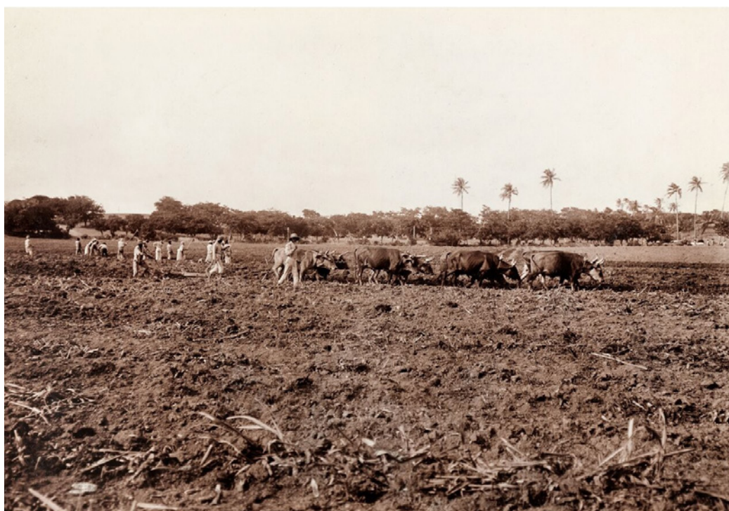
Arbejdet i sukkerørs- marken var hårdt og varmt.

for at kunne forsvare sig mod sørøvere og andre, som ville have øen. Fortet kaldte de Christiansfort efter kongen af Danmark-Norge. De begyndte også at dyrke bomuld til stof, indigo til at farve blåt med og tobak. Det var hårdt arbejde, og kun to år efter at danskerne havde koloniseret øen, købte de afrikanske slaver, som blev sendt til St. Thomas. Efter 25 år var der blevet sendt ca.