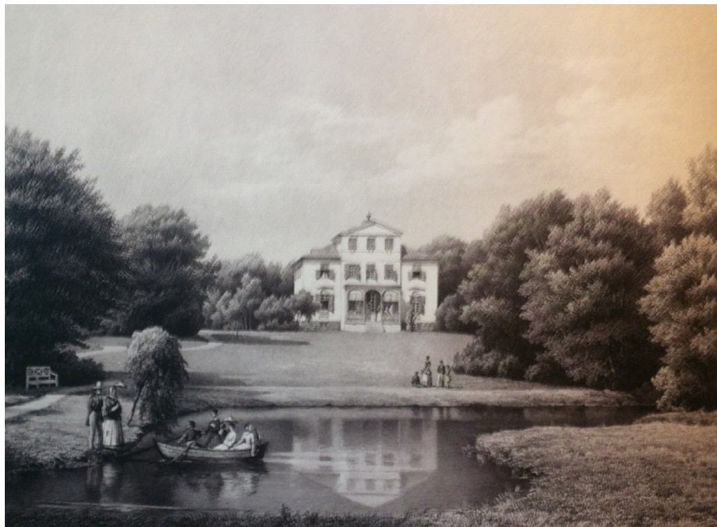
Øregård set fra parken.