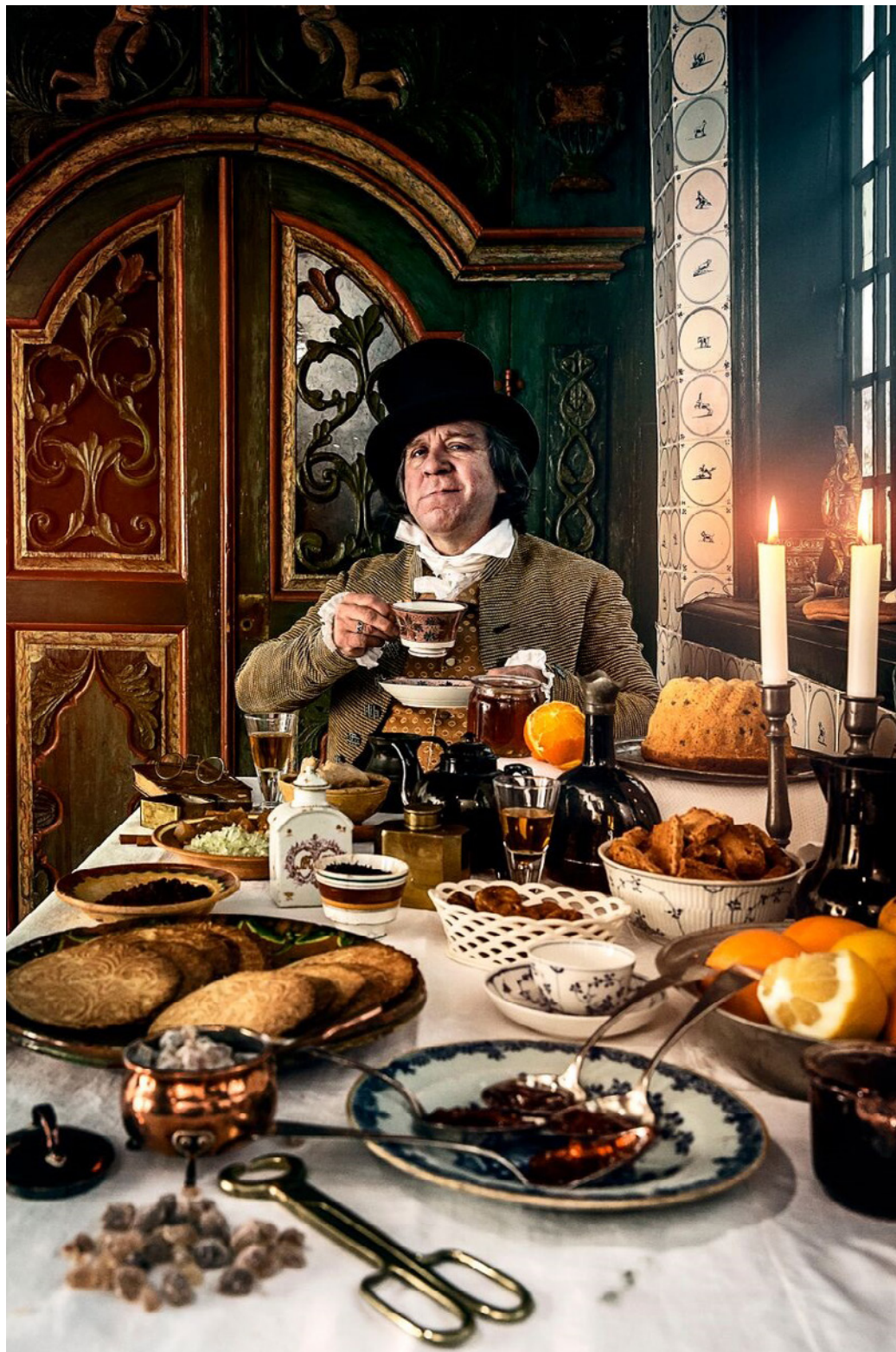
Den rige bonde.