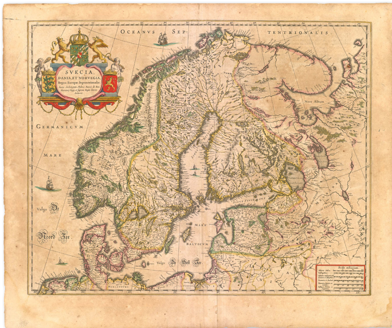
Danmark-Norges rige, 1645.

den danske krone kaldet Danmark-Norge. Landet strakte sig fra Nordnorge til Slesvig i det nordlige Tyskland. Derudover havde riget nogle kolonier: Grønland i Nordatlanten, Trankebar i Indien og Guldkysten i Vestafrika. Hertil kom Island og Færøerne i Nordatlanten. De blev ikke kaldt kolonier, men bilande. Danmark var altså betydeligt større end i dag. Med kolonier i Nordatlanten sad man på en stor del af salget af hval, sæl og narhvalstand. Da Kongeriget Danmark-Norge koloniserede Dansk Vestindien, regerede Kong Christian den 5. Kongen var enevældig, det vil sige at han bestemte alt i riget, med hjælp fra et rigsråd. Han kunne bestemme, hvem der skulle leve eller dø, om landet skulle gå i krig,