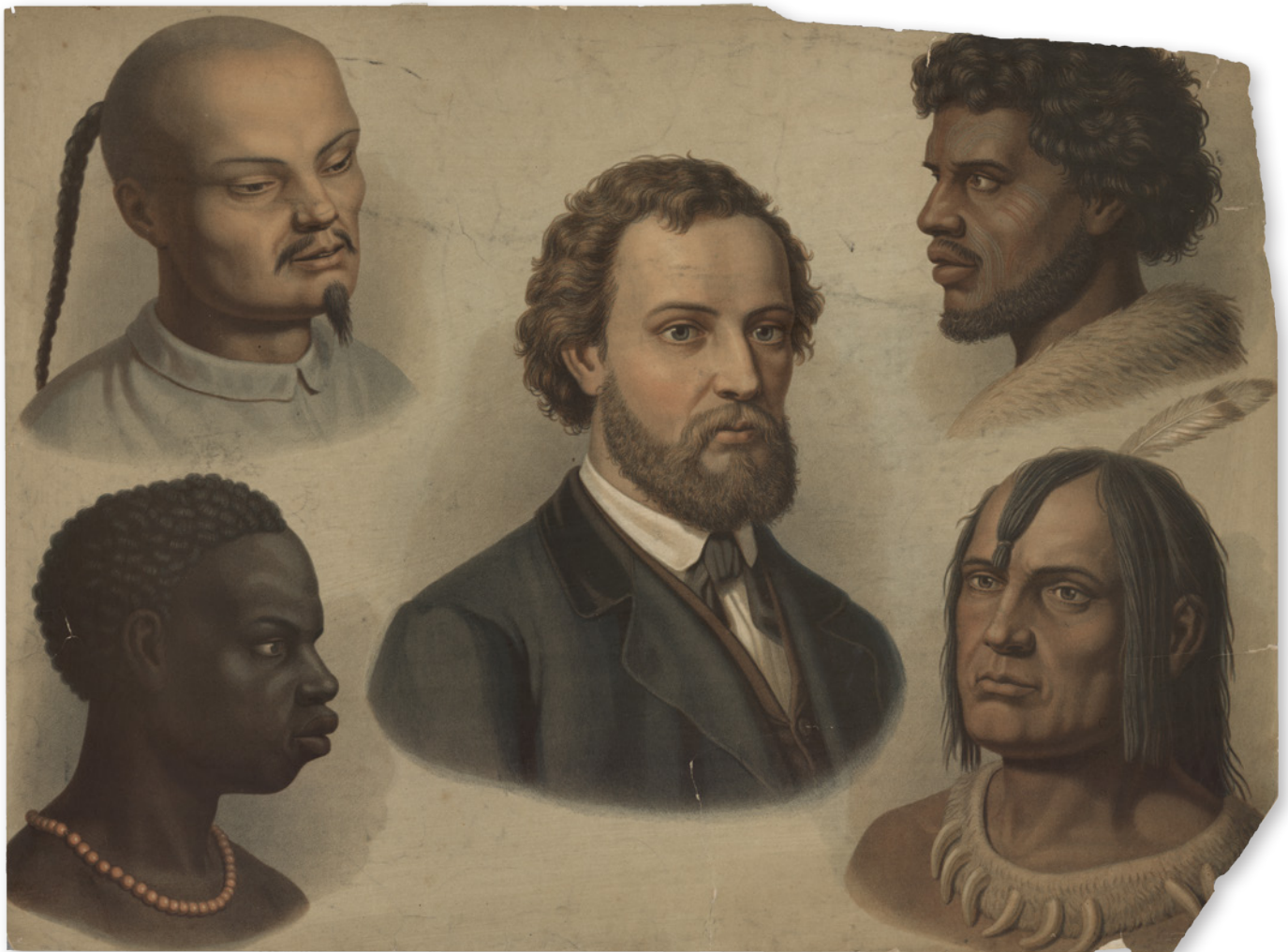
Folk fra andre dele af verden blev af europæerne betragtet som fremmede og primitive.

smerte. Derfor kunne de tåle hårdt arbejde, og kunne kun straffes med særlig brutale straffe, ellers mærkede de det ikke. Europæerne var kristne, dannede, civiliserede og kunne ikke tåle det hårde arbejde. Retfærdiggørelsen af slaveriet blev set i modsætningerne til disse fordomme. Kristendommen spillede en rolle i retfærdiggørelsen af slaveriet. Nogle så slaveriet som Guds straf af afrikanerne. Og Gud var jo retfærdig.