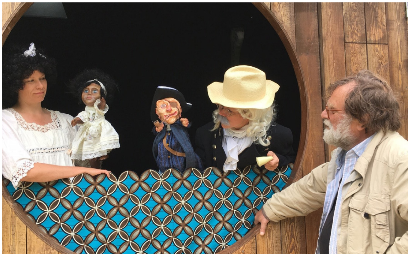
Instruktør og skuespillere under prøve.