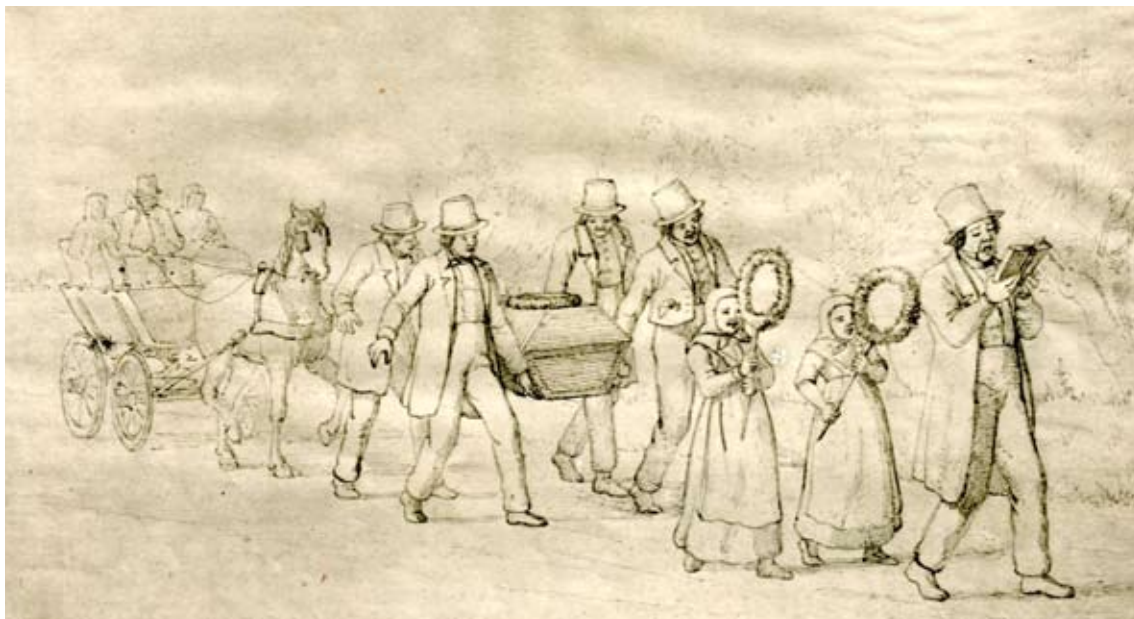
Ligtoget bliver ført an af degnen, som synger for. Bagved går 2 piger med grønne krans. Det sorte kiste bliver båret af 4 mænd. Familien sidder i vognen bag kisten. Tegning af Julius Exner 1866. (Nationalmuseet)