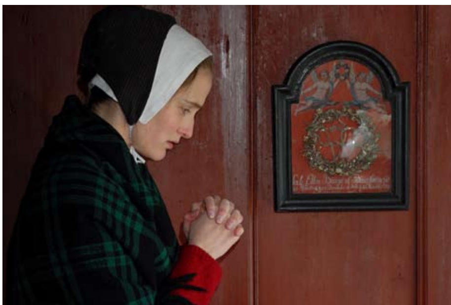
På mange gårde på Frilandsmuseet hænger mindetavler over afdøde. Det var en måde at huske de døde på. Det var ikke kun voksne, også børn har fået fine mindetavler.

Dødsvarslerne spillede en særlig rolle. Der kunne tages varsler af alt fra strå over kors til kragefugle på taget. Mange af disse varsler er nok blevet glemt igen, når de ikke gik i opfyldelse. Andre varsler var mere uhyggelige. Hvis man om aftenen eller natten på bestemte veje mødte det usynlige ligtog, som bevægede sig mod kirken, eller så en hvid skikkelse, kunne være det være et varsel om ens egen død eller døden for et medlem af familien. Det var særligt personer født på søndage eller helligaftener, som kunne se dem. For andre var det blot en fornemmelse eller uro hos hestene, når de usynlige døde kom forbi. Mere dramatiske varsler var når man mødte den tre-benede Helhest eller Kirkelammet. Det var sikre tegn på død.