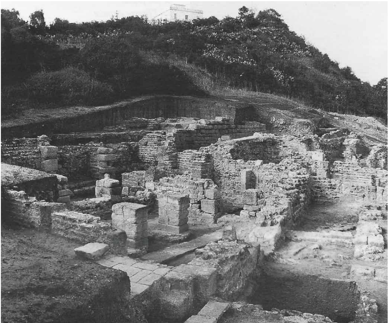
Fig.6 Nationalmuseets udgravninger i Karthago (Tunesien) 1975–81. På billedet ses den danske udgravningslokalitet i den vigtige oldtidsby Karthago, nord for vore dages præsidentpalads.

The National Museum's excavations in Carthage (Tunisia), 1975–1981. In the picture we see the Danish excavation site in the important ancient city of Carthage, north of the present-day presidential palace.