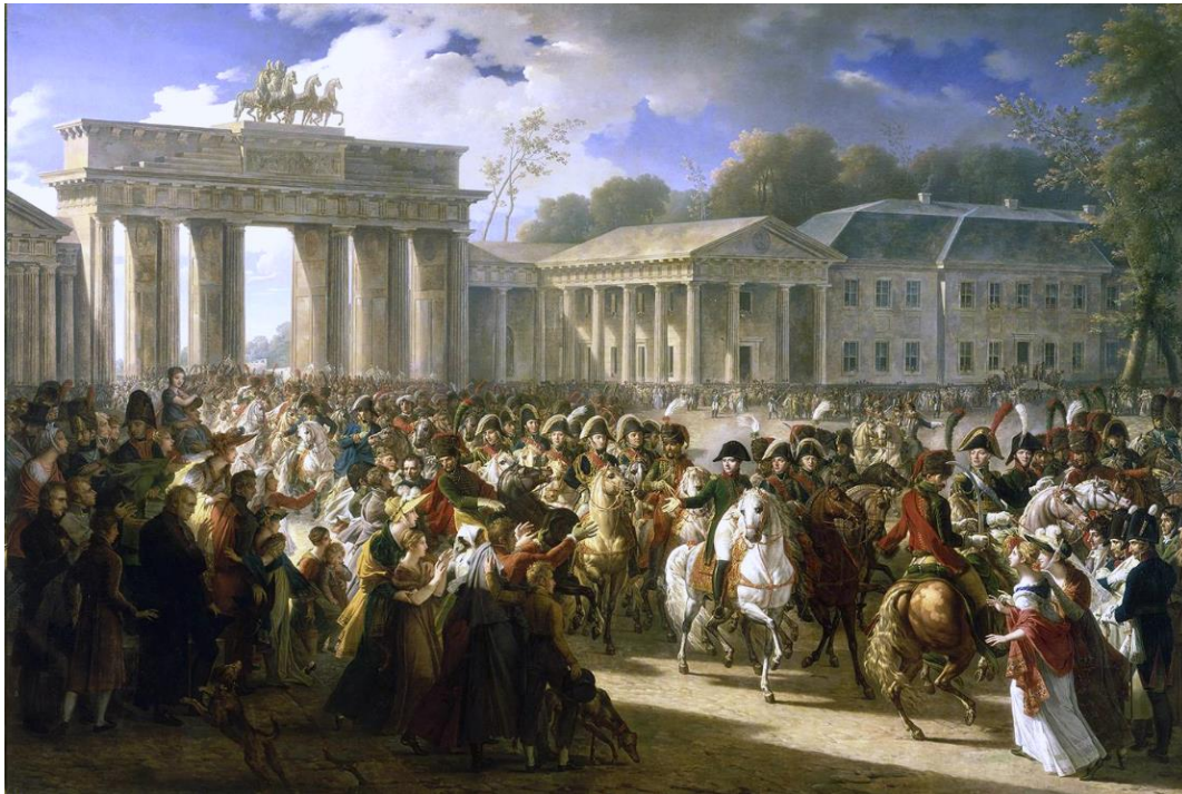
Napoléon Bonaparte indtager Berlin 1806

Gennem årene har man aktivt brugt historien til at skabe en fælles erindring og forståelse af landets fortid for at skabe sammenhængskraft. I starten af 1800-tallet indtog Napoleon store dele af de tysktalende områder. I 1806 kulminerede det ved, at Napoleon triumferende indtog Berlin og red gennem Brandenburger Tor. Fra 1807-1812 var alle tyske stater blevet underlagt Napoleons herredømme.