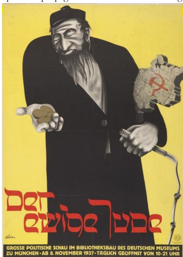
Plakaten 'der ewige Jude' (1937), Wikimedia Commons.

Nazisterne forsøgte efter 1. Verdenskrig at skabe en ny tysk kultur og identitet. Hitler udnyttede det politiske og økonomiske kaos efter 1. Verdenskrig og anvendte politiske propaganda til at fremme sin ideologi.