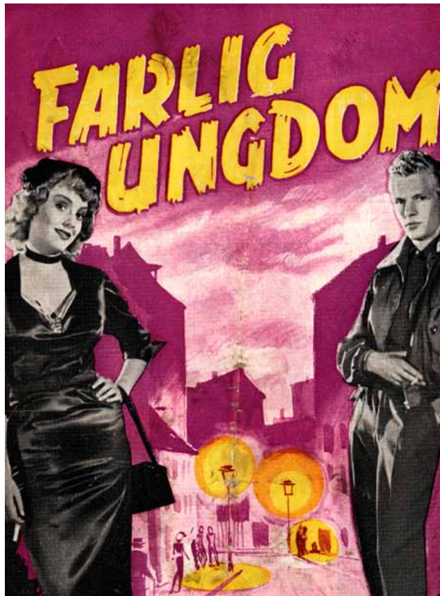
Forsidefoto fra programmet til filmen "Farlig ungdom" fra 1953. Filmen var den første egentlige danske ungdomsfilm.